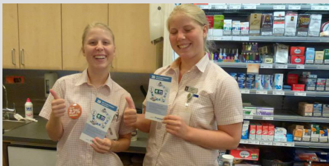
In Padborg, Dänemark, wurden die ersten DocStop-Anlaufstellen mit Infostellen an Raststätten und Tankstellen bereits 2013 eingerichtet.