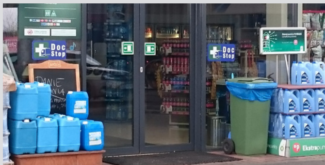
Mehr als 50 Ärzte, Kliniken, Raststätten und Transportunternehmen sind heute bereits Partner im DocStop-Netzwerk in Polen.