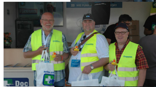
Am DocStop-Stand auf dem Nürburgring gab es nicht nur das ein oder andere Werbegeschenk, sondern auch Informationen aus erster Hand.